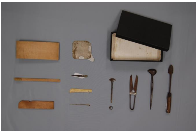
学習に用いた裁縫道具