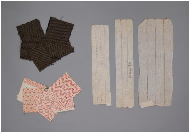
基礎的な縫い方を学習した資料