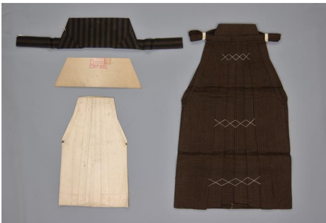
特に技術を要する部分に力点を置いて 学習したことを示す資料