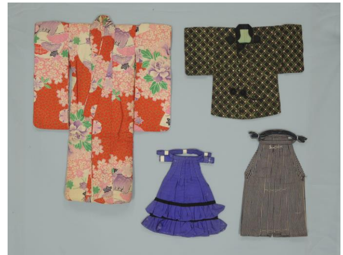
ミニチュアサイズで製作した衣服