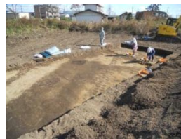
左：和田織部館跡の内部

平 成 25 年 11 月 11 日～12 月 9 日にかけて、11 箇所の試掘調査を行いました。和田織部館跡では、以前も「和田氏」の屋敷の囲土塼や堀跡の一部は地表から見ることができましたが、今回の試掘調査の結果、実際に堀跡の地下の様子が確認できました。また、屋敷の内部を仕切っている溝跡なども発見されました。今後は、和田織部館跡の土塼と堀跡の本調査や今回調査できなかった箇所について補足の試掘調査を行なう予定です。