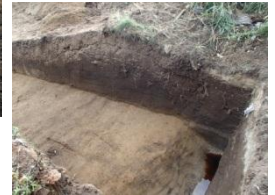
上：土塼と堀跡の一部