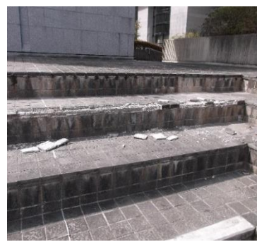
イベント広場で破損したタイル