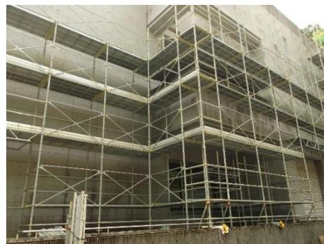
外壁の周りに設置された足場