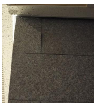
石壁に発生した亀裂