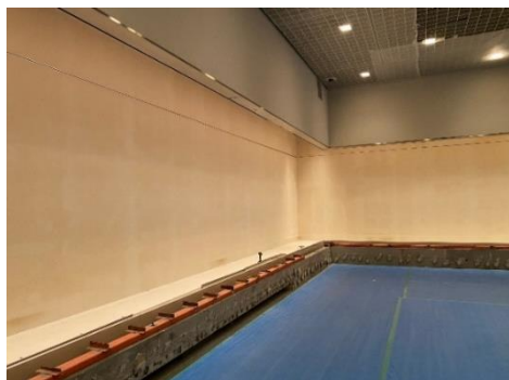
ガラス等が撤去された展示ケース

令和3年10月から工事が始まり、現場調査や工程作成を経て、リニューアルする展示ケースの解体や、給排水設備のうち受水槽の撤去、外壁への足場の設置等が行われてきました。