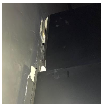
壁からはがれた展示ケース

総合展示室・特集展示室の展示ケースが壁からはがれて傾き、また、他の展示ケースにもゆがみが生じたほか、館内の石壁や館庭のタイルが破損するなど甚大な被害を受けました。大規模改修工事の工程との調整を図りながら復旧に取り組んでいます。