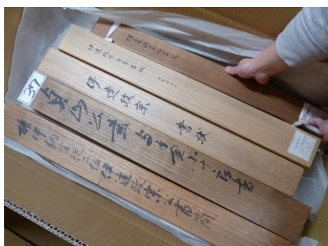
梱包作業の様子。箱に入れた古文書をさらに箱に入れて移動します。

工事期間中も、資料（文化財）を適切な温湿度の下で保管する必要がありますが、空調設備の更新中はその空調が停止するため、空調を順次更新するよう工程を組んでいます。学芸員は工程に応じて資料を梱包し、温湿度管理ができる部屋への移動を行っています。