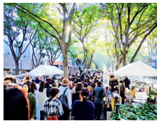
GREEN LOOP SENDAI