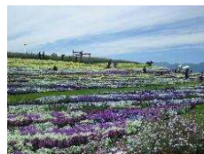
第36回信州フェア 長野県松本平広域公園