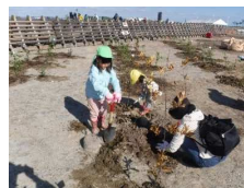
仙台市東部沿岸地域での市民植樹