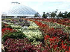
第35回やまぐちフェア 山口きらら博記念公園