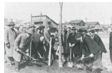
昭和26年の青葉通での植樹

みどりを活かしながら市民と一体となって取り組んだ復興のあゆみ、そして防災力の高いまちづくりを国内外へと発信します。