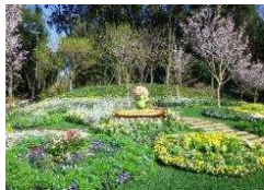
第33回よこはまフェア 郊外部の「里山ガーデン」