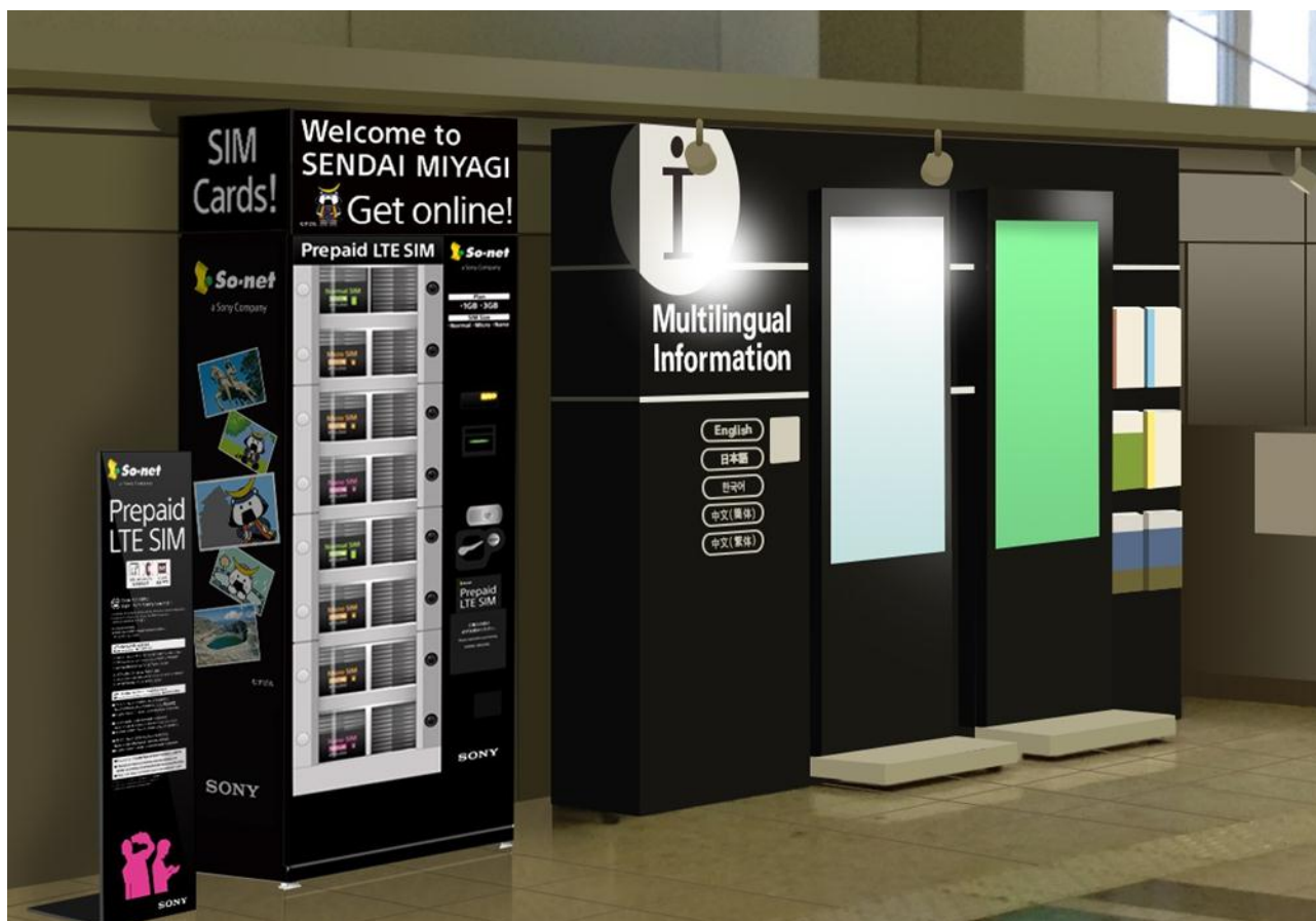
自動販売機設置イメージ

通常、外国人観光客が自分のスマートフォン、タブレット端末を自国外でインターネットに接続する際は、Wi-Fiスポットを探すか、Wi-Fiルーターのレンタル、本国で契約している通信会社の国際ローミングサービスを利用する等の方法がありますが、旅行先の国でプリペイドSIMカードを購入し、本国で利用していたSIMカードと差替えることにより、場所を問わず、便利にインターネットに接続することが可能です。海外では外国人旅行者向けプリペイドSIMカードが広く普及しており、日本国内でも徐々に普及しつつあります。