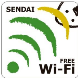
SENDAI free Wi-Fi ロゴマーク

記者発表資料 平成27年3月2日 (担当) 経済局国際プロモーション課 (直通) 214-8019 (内線) 729-3440