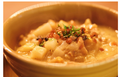
アメリカ名物クラムチャウダーで 貝の代わりにホヤを使った 「ホヤチャウダー」