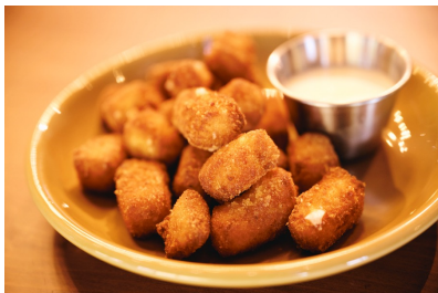
地元の蔵王チーズに製造を依頼した ウィスコンシン名物「チーズカード」の フライ