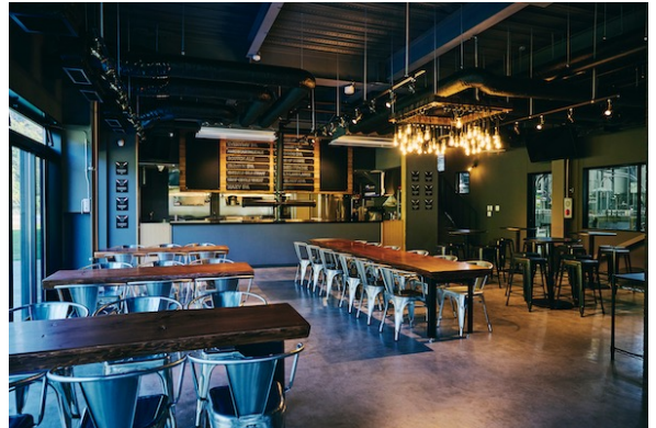
「クラフト x インダストリアル」がテーマのレストラン