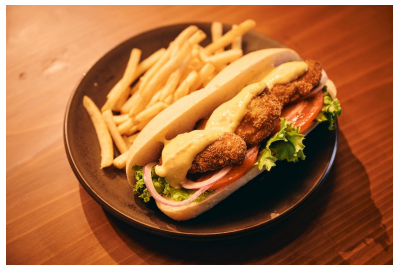
三陸産の牡蠣を使った カキフライのサンドイッチ 「オイスターボーボーイ」