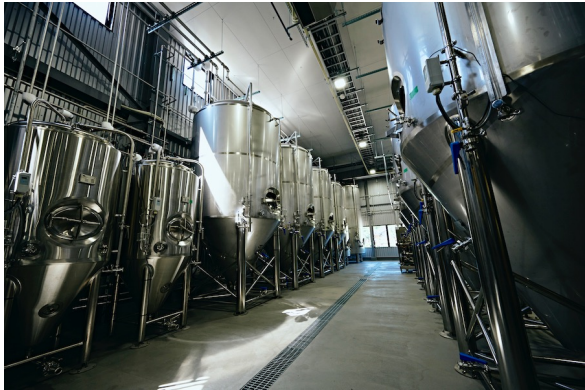
迫力あるビールの醸造設備

醸造設備について大きな初期投資をしており、多種多様なビールを製造していきます。また製造したビールは缶と樽に詰めて、地域はもとより全国に販売していきます。併設のレストランは80以上の客席があり、そこでは16種類の出来立てビールを、「宮城 x アメリカ」のオリジナルテイストの料理とともに楽しめます。