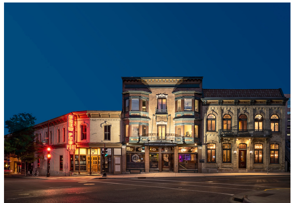
ウィスコンシン州のグレートデーン店舗