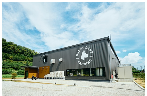
仙台市秋保のブリュワリーの建物