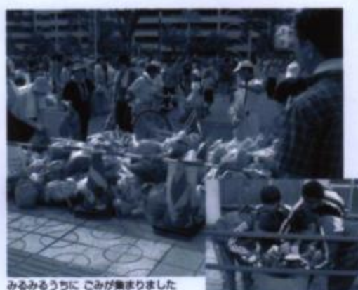
みるみるうちに、こみが集まりました