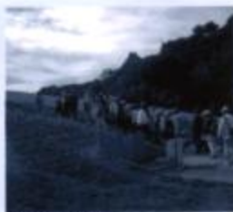
水の森キャンプ場

やってきました、探訪会当日。天気も上々の十月五日、泉区内を巡る探訪会の始まりです。まず最初に、