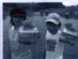
みて! こんな魚がいたよ

八月二日(火)、小学四、六年生とその保護者三十人余りが参加して七北田川自然観察会を開催しました。