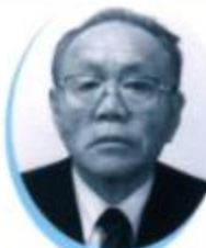
泉区まちづくり 推進協議会