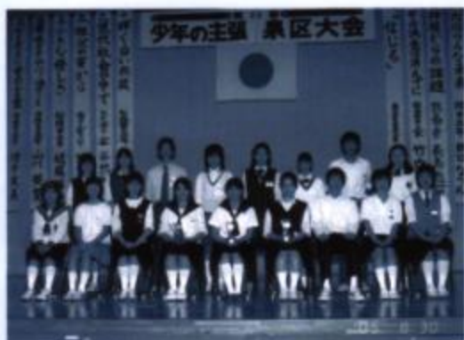
各中学校代表出席者のみなさん

第二十回大会となった十七年度は七北田中学校で開催し、区内の中学校代表が自分の言葉で、思いを熱く発表しました。