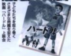
子どもたちを取り巻く、さまざまな問題を扱った映画「ハードル」上映会