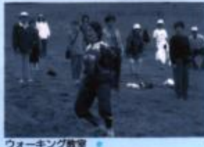
ウォーキング教室