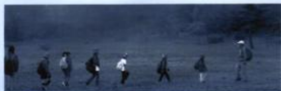
自然観察ウォークへさあ出発!

六月二十六日(日) には、会員の皆さん が自宅で大事に育て た苗を持ち寄って、 泉ヶ岳のコスモス園 で植え付け作業を行 いました。