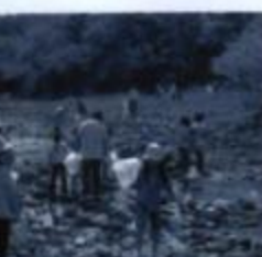
ただいま清掃活動中!

この日は千四百人の方が参加し、四会場に分かれてごみを拾いました。こみの中には車の廃タイヤやたたみ(1?)など、川にはあるはずのないものが多く含まれていました。