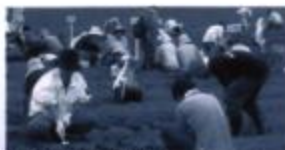
コスモスの植え付け作業

六月二十六日(日) には、会員の皆さん が自宅で大事に育て た苗を持ち寄って、 泉ヶ岳のコスモス園 で植え付け作業を行 いました。