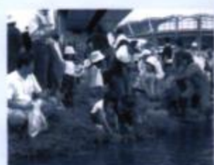
アユのすめる きれいな川でありますように