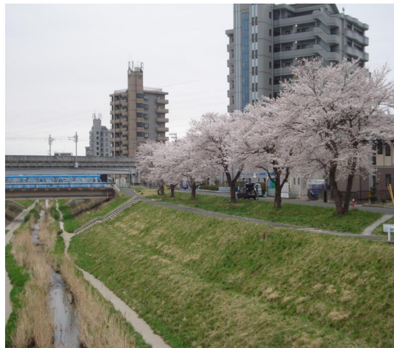
富沢包括版認知症ケアパス