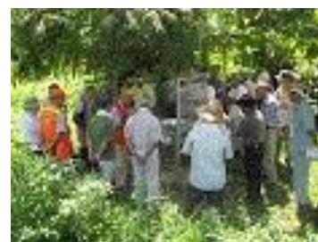
地域ぐるみのイノシシ捕獲対策で箱わな取扱いの説明を受ける地域の皆さん