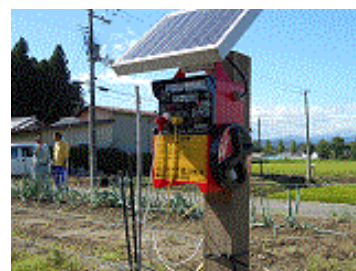
ソーラー式電気柵の電源機