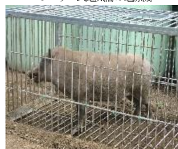
箱わなで捕獲されたイノシシ