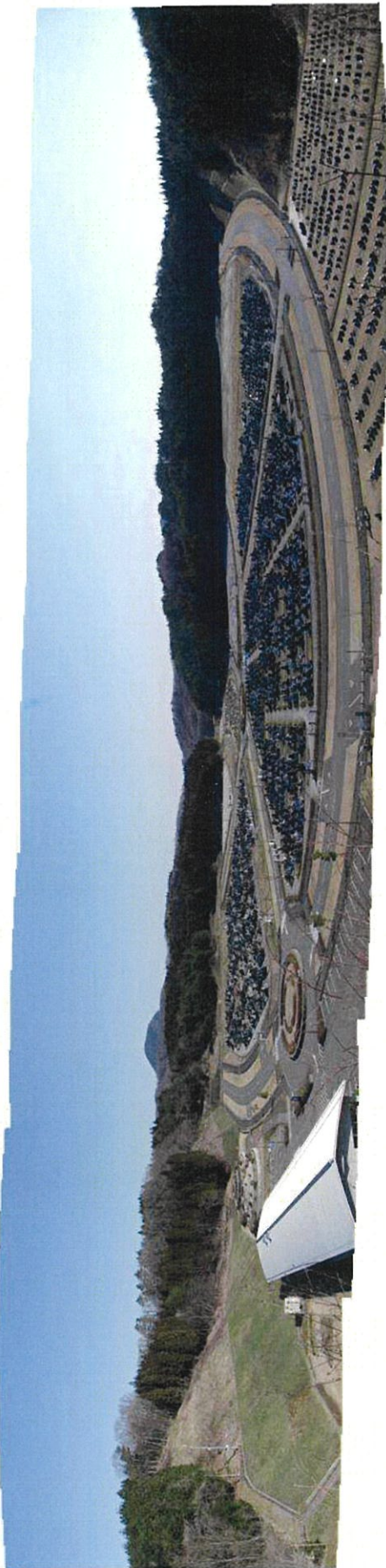
猛禽類調査地点MP 1パノラマ（平成23年4月5日撮影）