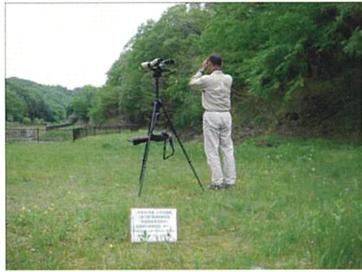
定点調査状況 5月（左 MP1 地点、右 MP2 地点、平成 23 年 5 月 19 日撮影）