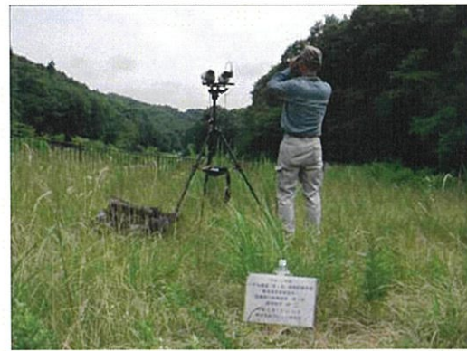
定点調査状況 7月（左 MP1 地点、右 MP2 地点、平成 23 年 7 月 26 日撮影）