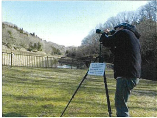
定点調査状況 4月（左 MP1 地点、右 MP2 地点、平成 23 年 4 月 5 日撮影）