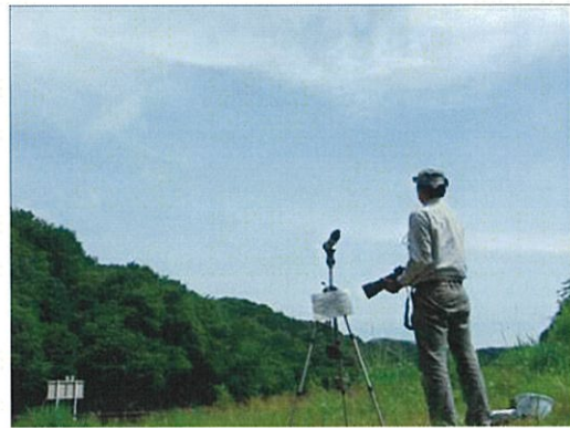
定点調査状況 6月（左 MP1 地点、右 MP2 地点、平成 23 年 6 月 16 日撮影）