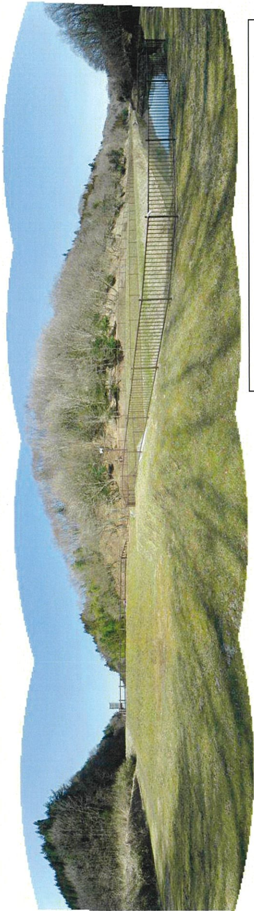
猛禽類調査地点MP 2パノラマ（平成23年4月6日撮影）