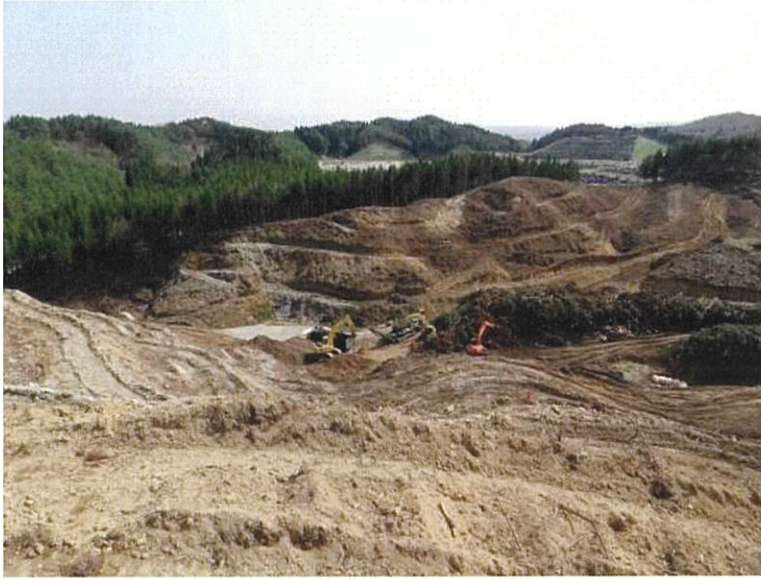
平成 24 年 4 月 28 日撮影