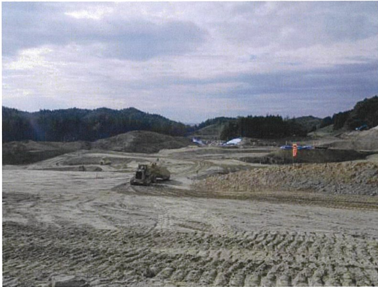
平成 24 年 10 月 25 日撮影