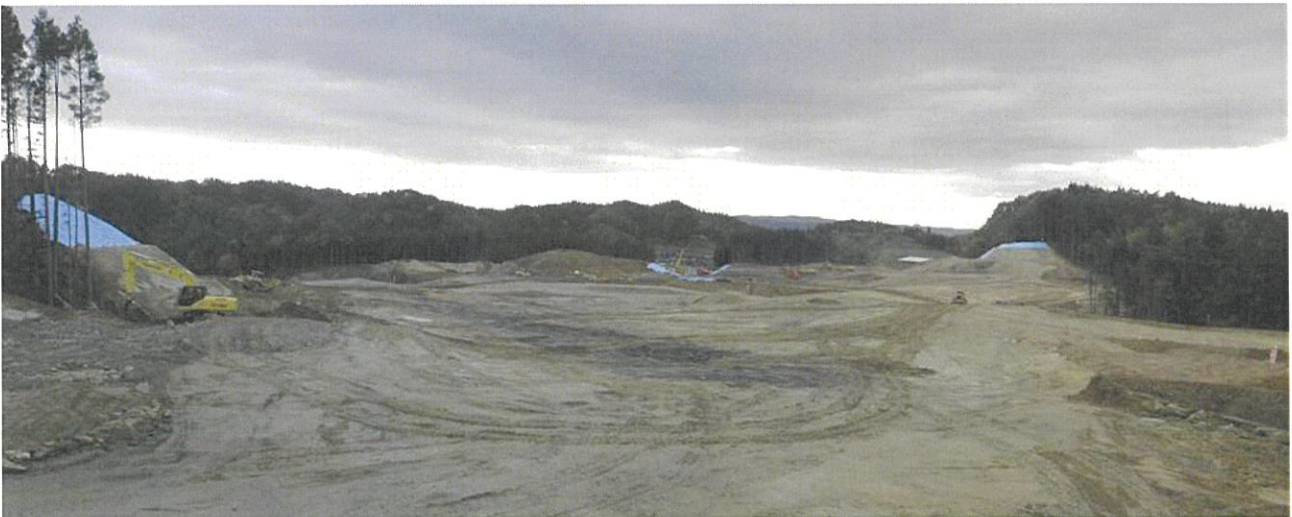
平成 24 年 11 月 22 日撮影