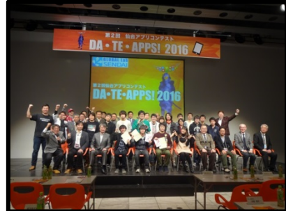
第2回仙台アプリコンテスト「DA・TE・APPS! 2016」