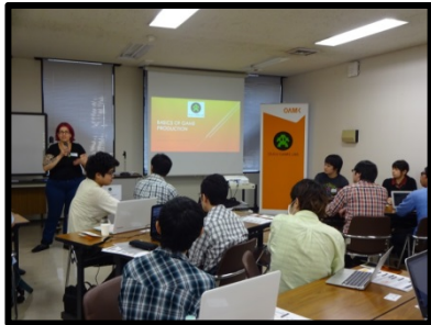
海外連携イベント「OGL Lab CAMP」