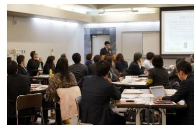
【セミナー開催の様子】