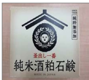
【商品開発を行った案件】 株式会社畑惣商店