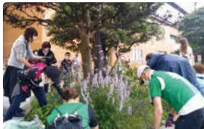
市民の皆さんと一緒に花壇の手入れや駅前清掃活動など行っています。

経営理念に基づき、マテリアリティ分析を踏まえたサステナビリティ戦略（「人権の尊重」「環境負荷の軽減と社会的責任の発揮」等）を策定しています。これらの戦略の中で、温室効果ガス排出量、水資源の使用の節減、廃棄物削減、森林保全など、持続可能なサプライチェーンの構築に向けて取り組んでいます。また、地域での取り組みとして、「一般社団法人花降る街仙台」さんの「仙台を花の街に計画」に参加しています。これは東北の玄関口である仙台駅ペDESTリアンデッキに花を植栽し、人と人との交流を生み出すことで、今後100年続く「杜の都仙台」の街づくりを目指す活動です。