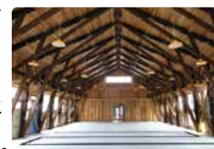
「新シザーズトラス構法」による建物

森林の間伐材に目を向けた当社は新たな使い道を工夫した結果、ボルトだけで簡単に作成できる新シザーズトラス構法を開発。この取り組みが「2019年度のグッドデザイン賞」という形で受賞することが出来ました。