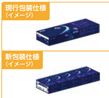
包装資材の簡素化の例

JTでは資源の節約およびごみの発生量を抑制するため、製品の包装資材の簡素化に取り組んでいます。