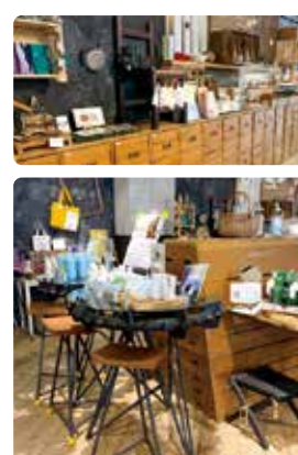
JACグループ「真野屋」で展開

人々が生活する上で不用となり廃棄されたモノに、アイデアを加えることで、より良いモノに生まれ変わらせる、暮らしのスタイルを提案しています。