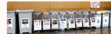
17分別の回収コーナー