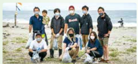
深沼ビーチクリーン参加メンバー

毎月第2日曜日に仙台市若林区の海岸で開催されている深沼ビーチクリーンに参加させて頂いております。地域の皆様と海岸清掃活動を通じて、社会・地域の本質的な課題解決に向けて取り組んでいきます。