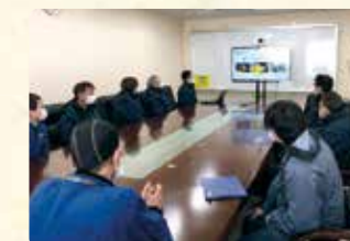
オンライン会議導入で紙類削減

コロナ禍に入って以来、各事業所へオンライン会議システムを積極的に導入することで紙類や出張旅費が大幅に削減、一方、営業部に於ける得意先様向けのプレゼン商談も全てタブレットを用いる事で紙から動画化した事でスムーズな商談に繋がりが成約数も徐々に増えてきています。