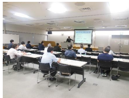
事業承継セミナー