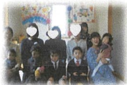
そつえん、おめでとう♡