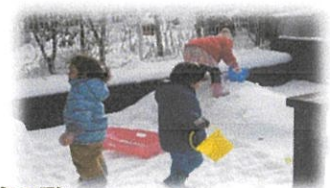
ふれあい遊び・わらべ歌・リトミック・運動遊び・季節の歌