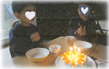
お誕生日 おめでとう！