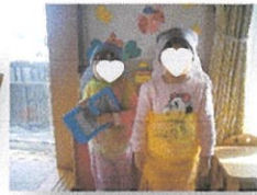
変身してプリンセス気分