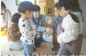
トントン、どうしましたか？ ちびっこドクターです！