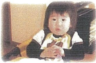
ひとりで食べられるようになったよ!