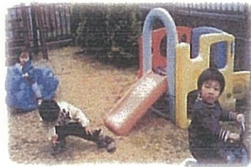
上手にこげるでしょう!