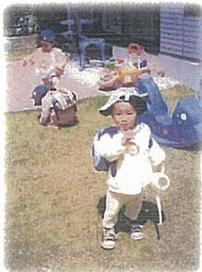
これから遠足に行くよ!