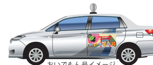
おいでもん号イメージ (実際の走行車両とは異なります)