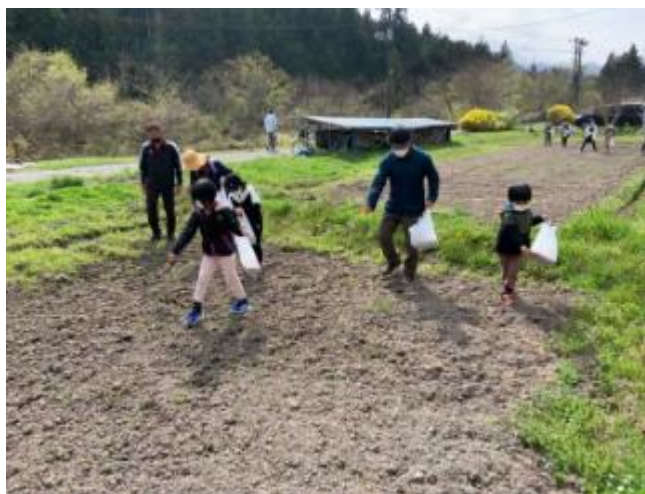
ひまわりの種まき