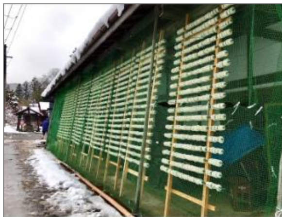
大根を寒風にさらす