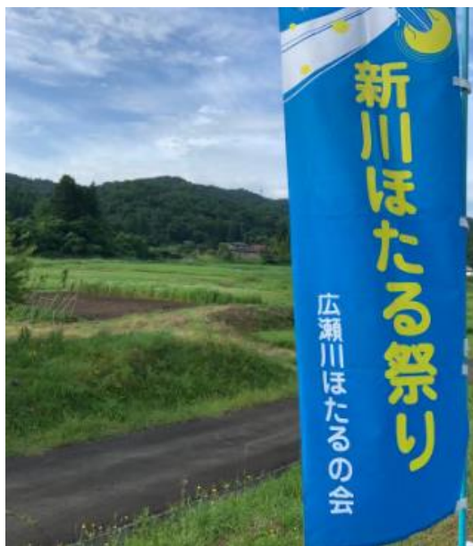
新川ほたるまつり