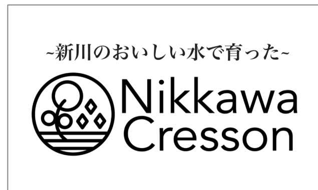
地元デザイナー作成のラベル