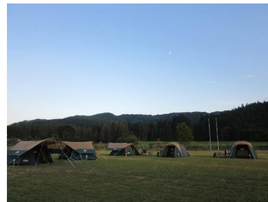
新川分校グラウンドのキャンプ

お問い合わせ・お申し込み TEL:022-391-4126 作並・新川地区活性化連絡協議会(地元雇用充実部会) 受付時間 10:00～16:00