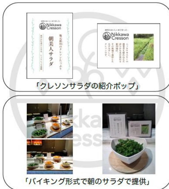
一の坊の朝食での提供