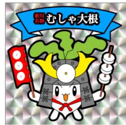
地元デザイナー作成の キャラクター