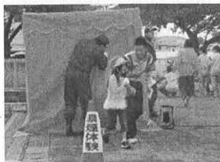
<小中合同訓練より>

<態度>火災想定避難訓練実施との関連性を生かした道徳の授業の実施「コースチャぼうやを救え」(11月)により、自らの危険を予知し、安全を確保する大切さを学んだ。