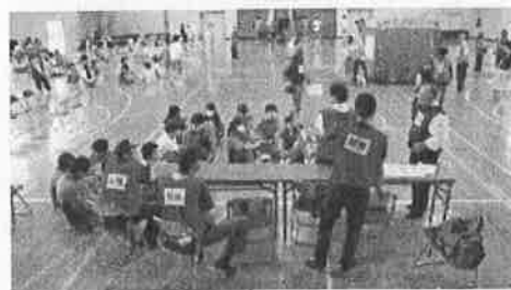
〈地域の方々各班に分かれて活動〉

各学年（避難所運営班、名簿班、パトロール班、炊き出し班、救護班）に分かれ、地域の方々とともに活動する。災害発生時に地域の一員として活動できる生徒を育てることを目的として、町内会で行う防災訓練に参加。最後に、地域の方々と一緒に炊き出しや非常食をとりながら、活動の振り返りを行った。