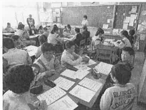
防災訓練の授業の様子