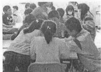
<小中合同授業より>

本校を指定避難所としている児童生徒の数は1000人を超え、地域や保護者の数を含めた、防災訓練への参加者は1300人という、規模の大きい防災訓練となった。活動の内容や準備計画において、繰り返し地域や関係機関と会議や打合せを重ねたことで、学校と地域と家庭がともに防災・安全について考えを深める契機となった。