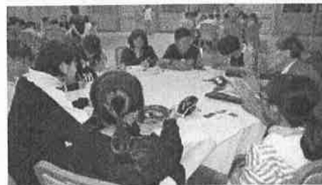
〈語り部さんとの交流会〉

南三陸町・気仙沼市で実施。気仙沼市内見学やリアスアーク美術館の学芸員の方の話や、語り部さんとの交流会を通して、当時の実情や復興の様子について学ぶ。最後に、お世話をしていただいた方へのお礼の意味を込めて「復興ソング 仲間とともに」を歌った。逆に感謝の言葉をいただき、自分たちも沿岸部の方々の力になれるということを実感できた。