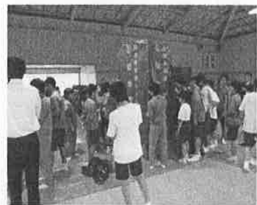
仮設トイレの設営訓練

6月には、地震想定での避難訓練の後、地区ごとに集まって、3年生の代表者が中心になる集団下校の確認をした。上級生が、同じ地域の下級生をリードしていこうという意識ができた。また、10月には、火災想定での避難訓練の後、2年生全体で仮設トイレとテントの設営訓練を行った。生徒たちは、震災のとき、周りの大人たちに守ってもらい、多くの世話をしてもらった。この訓練で、自分たちだけで被災者が使うトイレなどを作っていき活動を通して、自分たち中学生が守られる立場ではなく、家族や地域の人たちを守っていく立場にもなれることに気付くことができた。