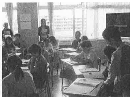
6年生 総合の授業の様子