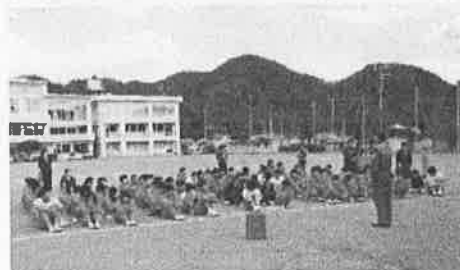
〈消防署の方からの講話〉

火災を想定して実施。生徒には、実施日時を明示せずに行った。ただし、事前に防災副読本を活用したり、火災発生時の行動について、シミュレーションする時間を設けた。当日は、3校時後の休み時間に実施した。次の授業の準備のため移動中の生徒やトイレにいた生徒など様々だったが、放送の指示をよく聞き、各自判断しながら大きな混乱もなく避難することができた。避難訓練後には、改めて自分の判断や取った行動、また、選んだ避難ルートなどが最も正しい選択だったのかについて振り返る場を設けた。