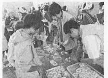
地区防災訓練での非常食調理

中学校として参加していないため、10月に2つの小学校で別々に行われた高森地区の防災訓練に延べ26名ほどの生徒がボランティアとして参加した。テント張りや炊き出しの準備、非常食の調理と配付など多くの作業を手伝った。大人と共に働くことで、自分たちが災害時でも多いに役立ち、共助できることを生徒たちは感じとっていたようである。その場にいた大人たちも中学生の働きぶりにとっても感心し、災害時にも頼りにしたいという声をいただいた。