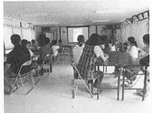
↑ 防災学習会の様子

9月の小中学校連携防災訓練に向けて、夏休みの宿題として、自宅近くの「いっとき避難場所」と「がんばる避難施設」の場所を調べる課題を出した。予備調査では、地域の避難施設を理解していた生徒は、5名ほどだった。また、昨年度の台風で被害を受けた学区内の2地区では、町内会主催の防災学習会が開催され、非常時の避難場所やとるべき正しい行動などについて児童生徒にお話いただいた。