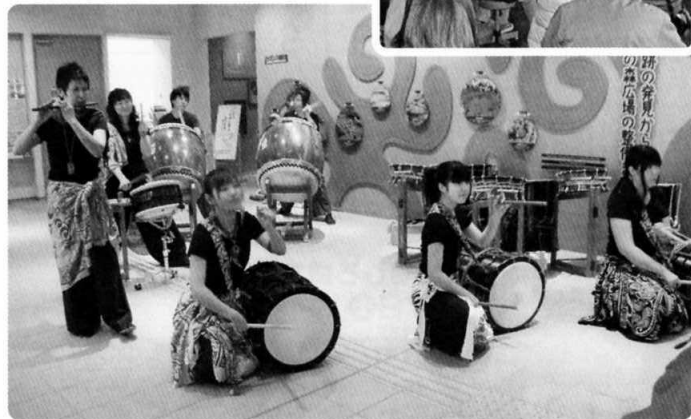
※掲載している写真は、いずれも昨年度のようすです。