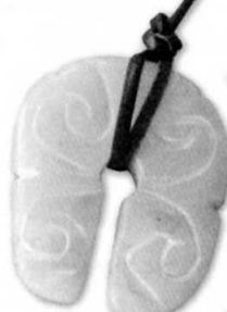
▲3/17 開講予定 「滑石アケセサリーをつくらう」見本

縄文の森ならではの、この日限りの縄文体験をご用意しています。じっくり体験に取り組みたい方におすすめです!!