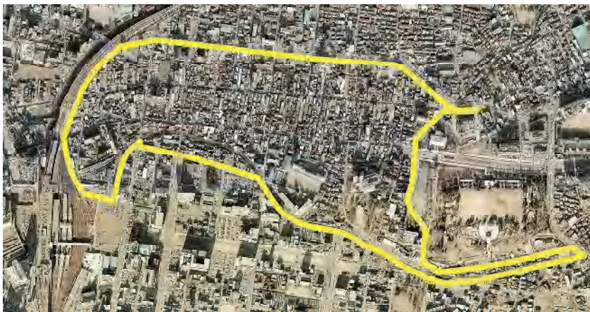
整理前の状況(昭和62年)