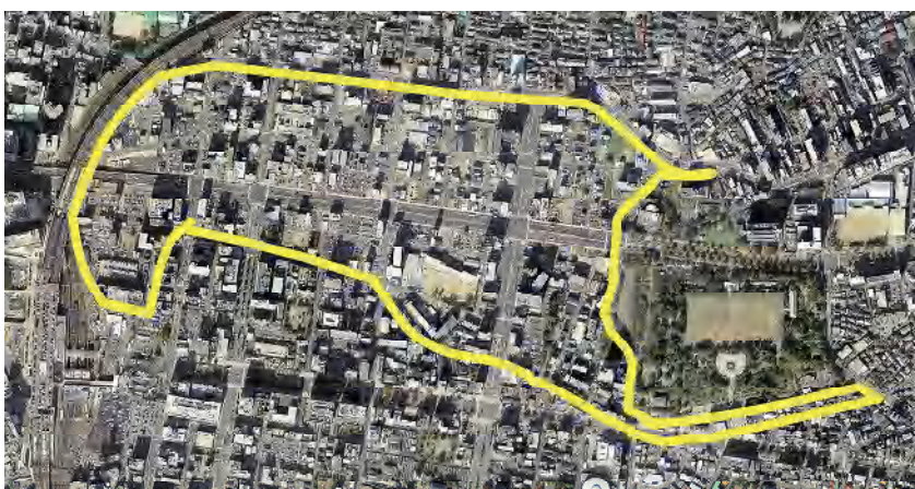
整理後の状況(平成26年)