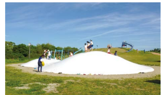
平成30年 2018.7 海岸公園が全面再開