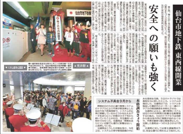
平成27年 2015.12 地下鉄東西線開業