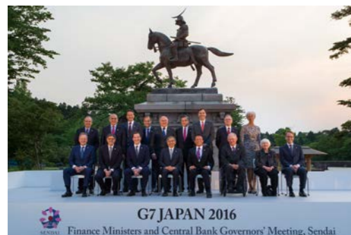
平成28年 2016.5 G7仙台財務大臣・中央銀行総裁会議