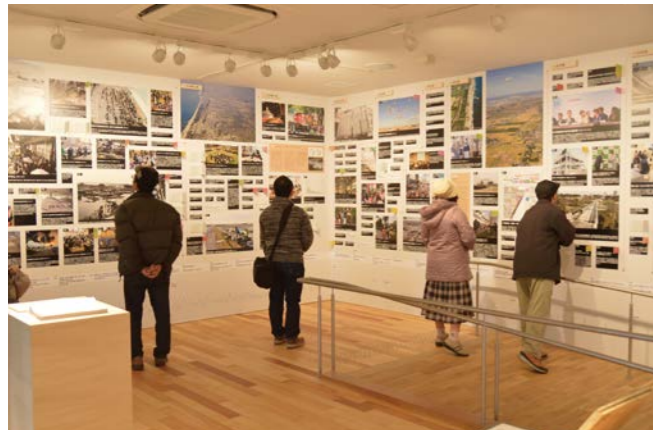
平成28年 2016.2 せんだい3.11 メモリアル交流館オープン

平成23年3月11日に発生した東日本大震災は、仙台・東北に未曾有の被害をもたらしました。本市では、東北全体の復興をけん引するため、被災地最短の5年間の震災復興計画を策定し、国内外の多くの方々から支援をいただきながら、復旧・復興事業に取り組みました。