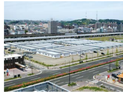
仙台市最大入居世帯数となった「あすと長町のプレハブ仮設住宅」 (平成23年 2011.5撮影)