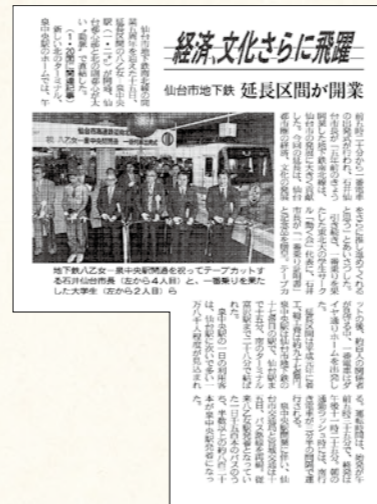
平成4年 1992.7 八乙女~泉中央間開業

将来の都市の発展を見越し、1960年代前半から検討が進められてきた地下鉄南北線が昭和62年に開業。平成27年には、地下鉄東西線が開業し、東西南北を十文字に結ぶ都市交通網が完成しました。