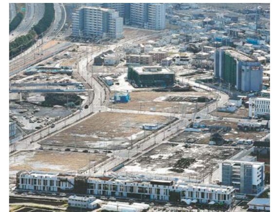
災害公営住宅や住宅地が整備され、新市街地の形成が進む荒井駅周辺 (平成27年 2015.12撮影)