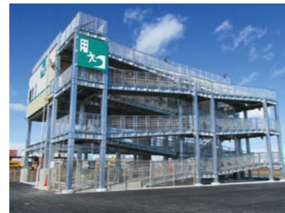
平成27年 2015.2 中野五丁目津波避難タワー完成