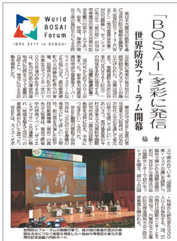
平成29年 2017.11 世界防災フォーラム／防災ダボス会議@仙台2017開催