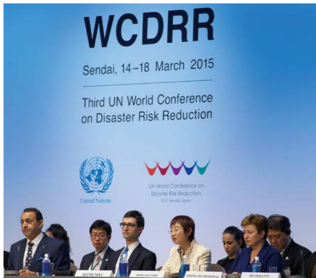
平成27年 2015.3 第3回 国連防災世界会議、仙台市で開催

震災から4年後の平成27年、日本で開催された国連関係の国際会議としては最大級の会議が仙台で開催されました。本体会議には185カ国の政府代表団などが参加し、新たな国際的な防災指針となる「仙台防災枠組2015-2030」及び同枠組推進に向けた政治的決意を表明する「仙台宣言」が採択されました。