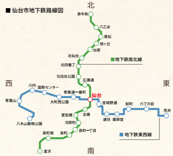
平成27年 2015.12 地下鉄東西線 開業記念式典