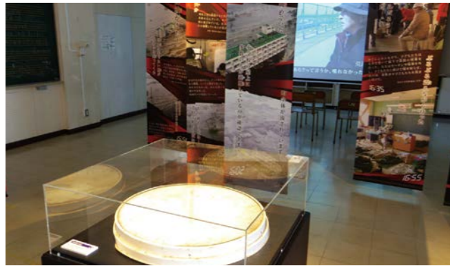
平成29年 2017.4 震災遺構 仙台市立荒浜小学校公開開始