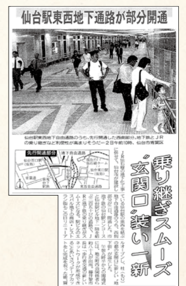
平成28年 2016.3 仙台駅東西自由通路 使用開始