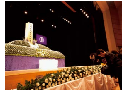
平成23年 2011.7 東日本大震災仙台市慰霊祭 (仙台国際センター)