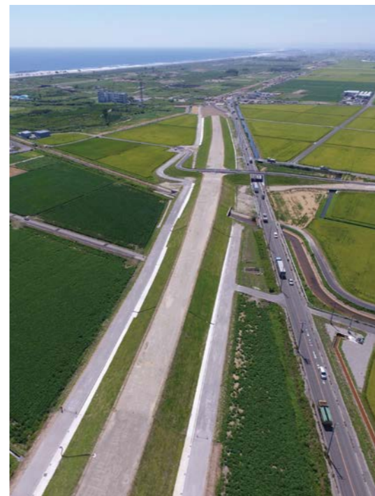
約6メートル盛土し、堤防機能を持たせた「東部復興道路(かさ上げ道路)」の工事が進行中 (平成30年 2018.8撮影)