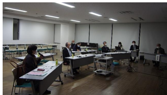
事業計画説明会(令和4年3月開催)の様子