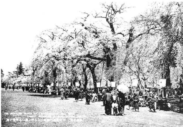
榴岡公園は昔から花見の名所だった。

ている。元禄八年綱村は母公三沢初子の冥福のため釈迦堂を建て、馬場と的場を設け、京都から彼岸桜と枝垂桜千株をとりよせて集植し土民遊楽の場所とした。桜は枯衰し国名勝指定を解除された。 【仙台の文化財】より