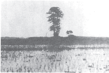
南ノ目館跡の杉木立