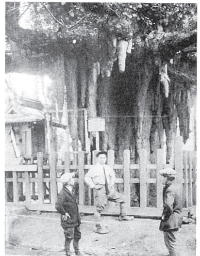
永野邸の乳銀杏 (大正時代)