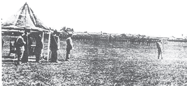
東宮さま（後の大正天皇）をお迎えしての分列式（明治41年）

演習が、南北両軍にわかれ七北田川そのほか県内各地で展開された。23日には有終の美を飾る観兵式が宮城野原で行われた。参加した航空隊の陸軍機もその威容を示した。