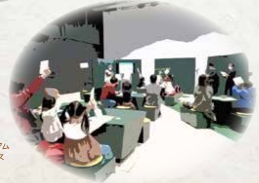
ミュージアム ユニバース