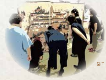
図工・美術科研修