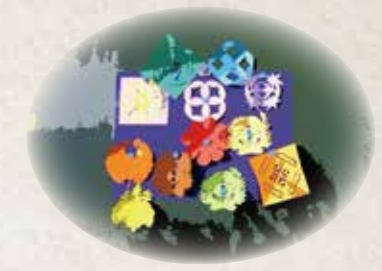
もんざり遊び体験