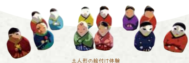
土人形の絵付け体験