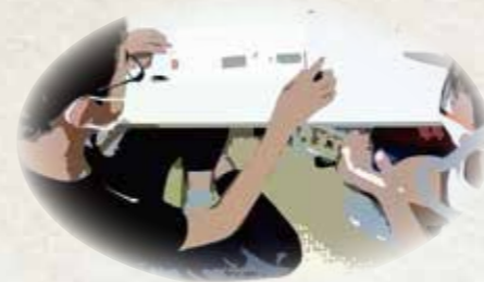
実学プロジェクト