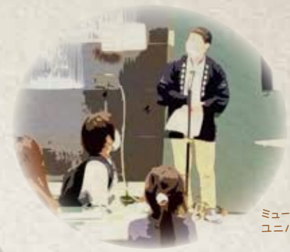
ミュージアム ユニバース