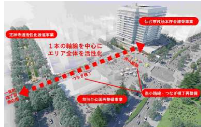
勾当台公園周辺事業