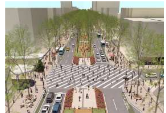
定禅寺通再整備のイメージ