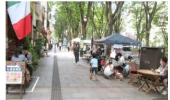
道路空間の利活用