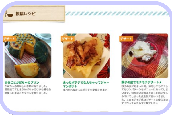
▲モッタイナイキッチン投稿レシピ