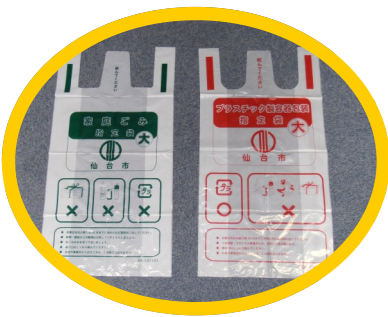
▲ 指定ごみ袋は、市のごみ処理費用の貴重な財源となります

逆に大変なことは、業務によって全く異なる知識を要することです。私は現在、指定ごみ袋の仕様作成・発注を担当していますが、請負業者との打ち合わせでは専門用語が飛び交います。製造単価を積算するために、原油価格や為替相場をチェックすることも…。市民生活に欠かせないものですので、何度も検査やチェックを重ね、ようやく納品されたときには達成感があります。地味な仕事ではありますが、自分の仕事が仙台の廃棄物行政の一端を担っているという気概を持って業務にあたっています（入庁3年目職員）。