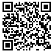
▼モッタイナイキッチンQRコード

また、1月21日～28日にせんだいメディアテーク等を会場に開催されるアートフェスティバル「資源ナーレ」では、捨てればごみになる「資源」に改めて注目していただくことを狙いとして、リユース・リサイクルした素材でつくった作品展示やワークショップ、ゲストによるトークショーや音楽イベントなどが行われます。ぜひご来場ください！