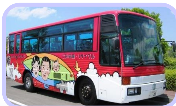
▲ワケルくんバスで、ごみ焼却工場や資源化センター等の環境施設を見学してみませんか？