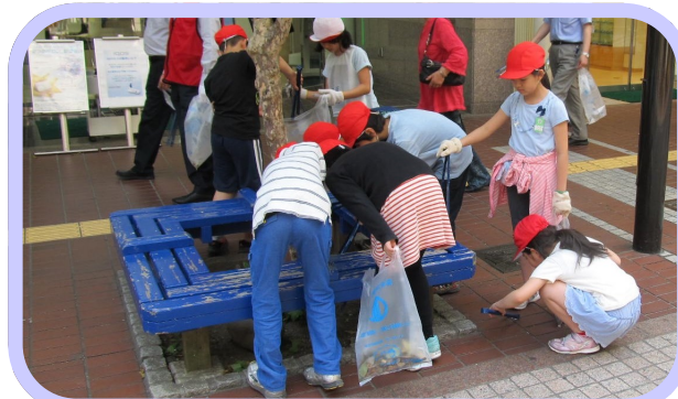
▲毎年春・秋には、市民のボランティアの皆さんとともに、街のポイ捨てごみを拾うキャンペーンを実施

ごみ減量キャンペーンや分別講座を通して、リサイクル意識の向上や正しい分別ルールの啓発のほか、町内会や子供会が実施する集団資源回収の支援も行っています。また、葛岡・今泉工場に併設している「リサイクルプラザ」では、まだまだ利用可能な粗大ごみや市民の方から持ち込まれたリサイクル品を展示し、希望者に提供を行っています。