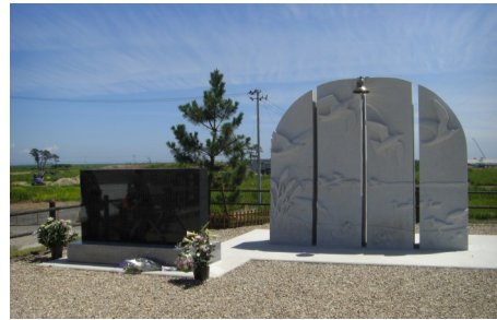
《右：希望の鐘 左：希望の絆中野》

式典の締めは中野小太鼓。閉校式以来のお披露目となるため、中野小卒業生と元職員が夏休みに集まって猛練習し、いつもと変わらぬ勇壮な音色を響かせました。