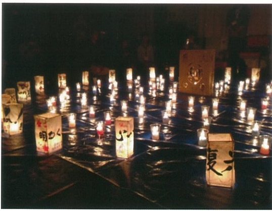
▲3・11キャンドルナイトの光景

震災から2年が経った今でも生活再建へ向けて、支援を必要とする声は多くあります。POSSEは今後も暮らしに密着した継続的な支援を行い、みなさんの力になりたいと考えています。