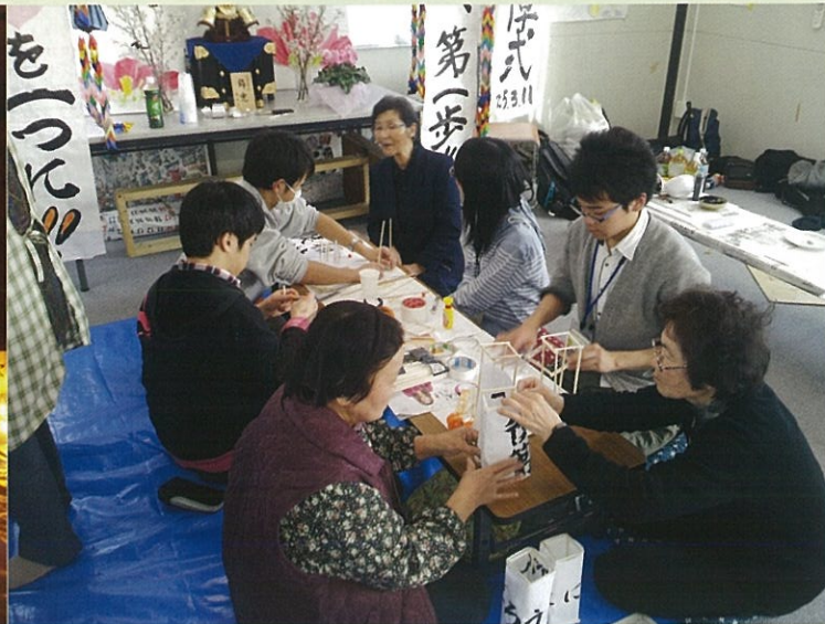
東日本大震災から2年後の3月11日。昨年に引き続き、扇町1丁目公園仮設住宅でキャンドルナイトが開催されました。震災が起きた14時46分に黙祷を捧げ、その後も住民の方々と