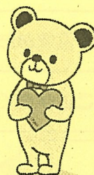
仙台市こころの健康づくり キャラクター 「ココまる」