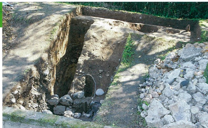
土塁の調査の様子(西から)

現在仙台市博物館の敷地となっている三ノ丸跡は、江戸時代の城下絵図では「蔵屋敷」「御米蔵」「東丸」と記されており、北側を五色沼・東側を長沼と呼ばれる水堀と、その内側の土塁に囲まれています。今回調査した巽門近くの南端部は、土塁をつくるために少なくとも高さ約2mの積み土をしていたことがわかりました。積み土は岩や石を多く含み、上部からは瓦片が多く出土しました。