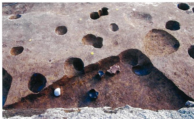
平安時代の竪穴住居跡