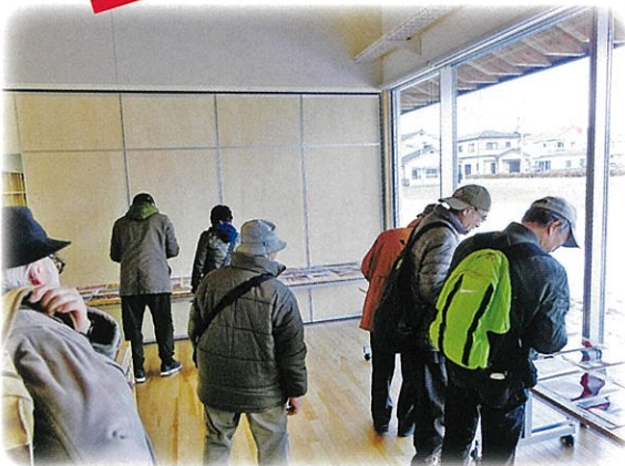
コンテスト期間中の様子