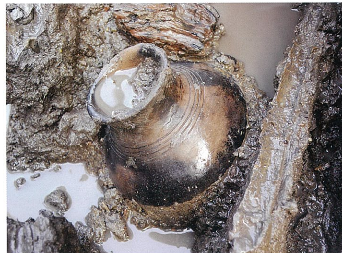
河川跡から出土した弥生土器