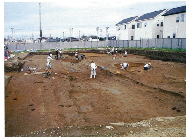
調査区全域(西から)

鍛冶屋敷前遺跡は、地下鉄南北線富沢駅の西方約1kmに位置する縄文時代と平安時代から中世にかけての遺跡です。今回の調査では、平安時代の竪穴住居跡6軒、竪穴遺構2基、溝跡・土坑が確認され、土師器・赤焼土器・須恵器・緑釉陶器・土製品・石器・金属製品などが出土しました。竪穴遺構からは、10世紀前半に使われた赤焼土器の小皿がまとめて出土しています。