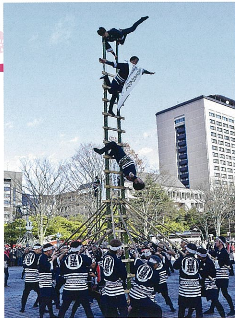
平成30年仙台市消防出初式での 青葉消防団階子乗り隊の演技

仙台消防階子乗りは、城下町を基盤に発展してきた本市の歴史を示し、都市における民俗のあり方を伝えるものと評価され、平成29年11月、仙台市指定無形民俗文化財に指定されました。