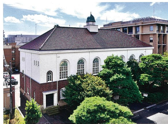
旧東北帝国大学附属図書館閲覧室(東北大学史料館)