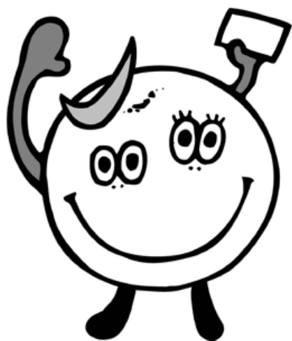
仙台市選挙マスコットキャラクター「てとりん」