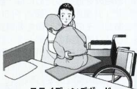
スライディングボード