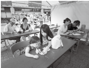
▲短冊に願い事を書いて、市民広場の笹竹につります

●日時＝8月6日(土)～8日(月)11:00～21:00 ●会場＝勾当台公園市民広場、定禅寺通緑地等