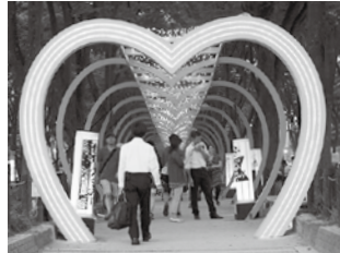
▲定禅寺通には天の川をイメージした光のトンネルを設置