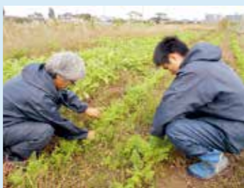
農作業では、種まきや収穫、出荷までの作業を通して就労のための基礎を養います