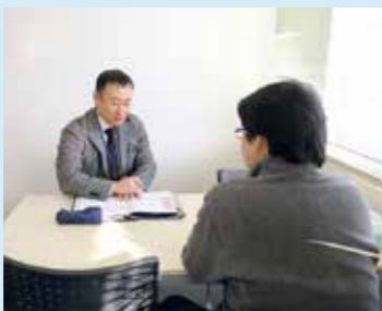
就活講座として、希望者向けに模擬面接なども行っています