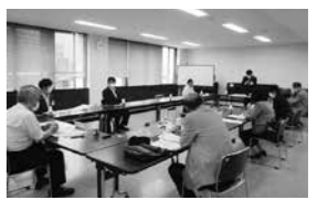
▲第1回泉区役所の建て替えに関する懇話会