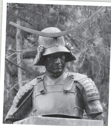
現在の2代目騎馬像は、この初代騎馬像と同じ型から作られました