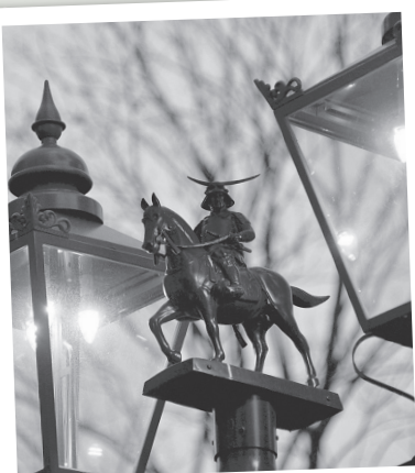
ガス灯の色合いに寄せたLED灯。政宗公とともに夜の街をロマンチックに演出します