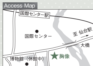
青葉区川内追廻3(青葉山公園内)