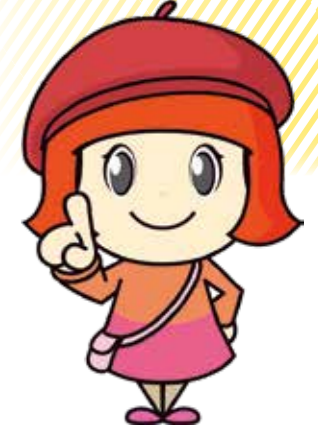
▲消費生活センターのマスコットキャラクター「さっち」。危険やトラブルを察知する女の子

この特集に関するお問い合わせは、消費生活センター☎268・7040、FAX268・8309