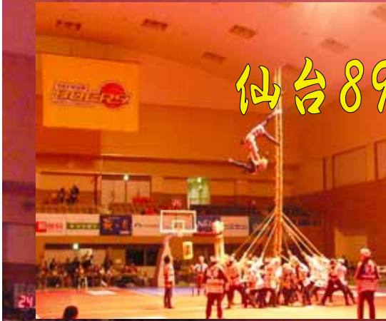
宮城消防団階子乗り隊

11月9日は火災予防週間の初日、この日、仙台3つめのプロスポーツチーム、プロバスケットボールの仙台エィイヶヶズの2006・2007 シーズン開幕第2戦があり、宮城消防団階子乗り隊が仙台消防階子乗りの演技を披露して、仙台市青葉体育館に集まったブースターの前で、火災予防を呼びかけました。