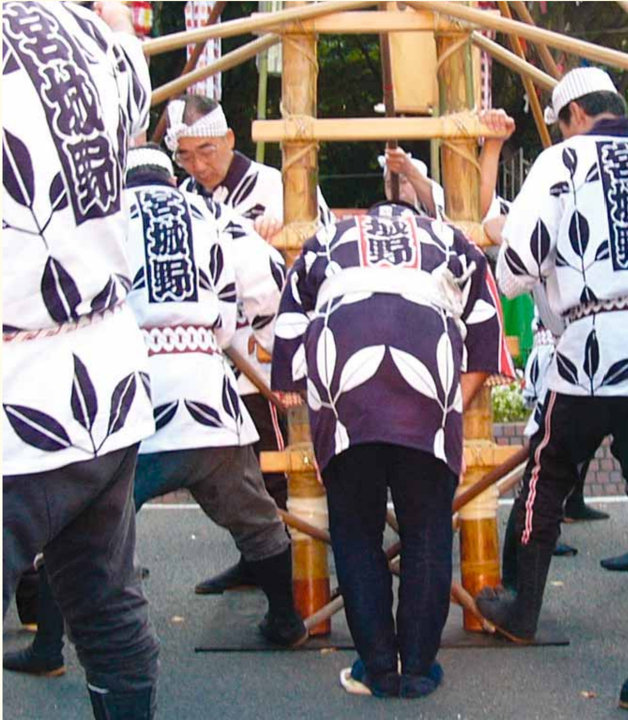
平成18年仙台七夕「星の宵まつり」(定禅寺通)