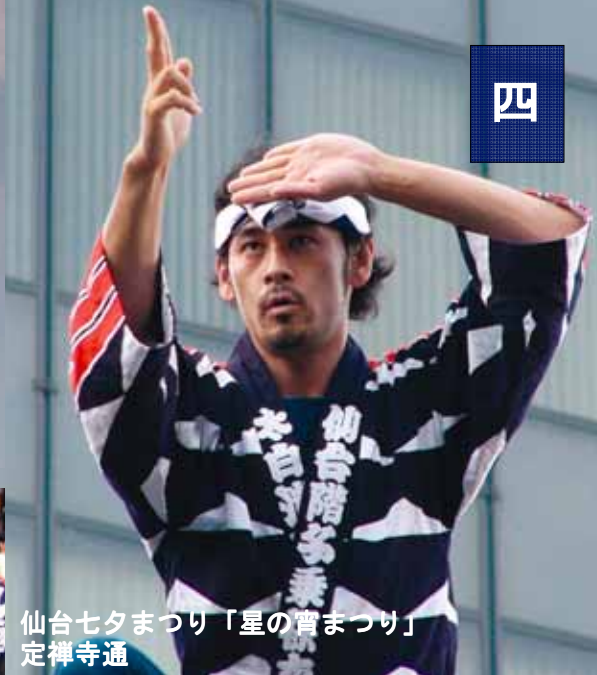
仙台七夕まつり「星の宵まつり」 定禅寺通