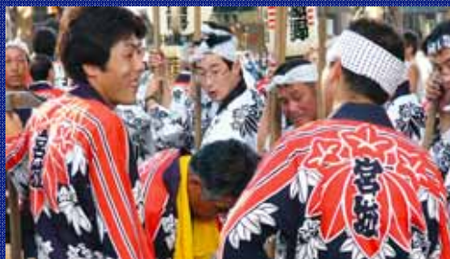
仙台七夕まつり 入場前の風景