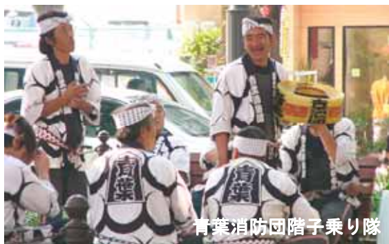
青葉消防団階子乗り隊