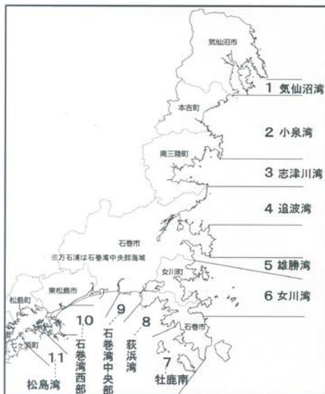
平成 29 年度ノロウイルス自主検査海域