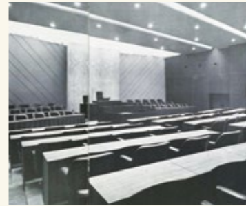
社団法人 建築業協会 「建築業協会賞作品集」第8回 P96

議会棟は、第三代本庁舎とともにつくられました。議場では、市政の重要課題について様々な議論が交わされてきました。