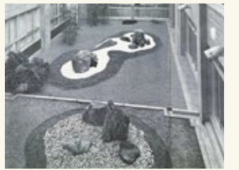
社団法人 建築業協会 「建築業協会賞作品集」第8回 P99