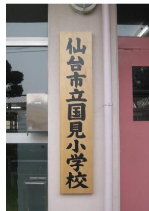
設置された校名板

また、児童数の増加並びに老朽化に伴い行われる国見小のトイレ改修工事は、27年度・28年度の2年度に渡り、それぞれ7月から11月に施行される予定です。主な改修の内容は、清潔感とにおい対策を考慮しトイレの床と壁を乾式にするとともに、男女とも洋式の便器を増やすというものです。大きな音が出る工事は夏休み中に行い、児童の学習に支障のないよう進めますが、学校周辺の皆様には、大変ご迷惑をおかけいたします。どうかご理解とご協力をよろしくお願いします。