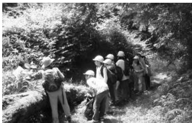
【6 学年 地底の森ミュージアム交流学习】