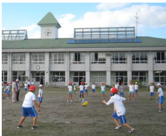
クラブ活動での交流の様子

学年ごとに両小の児童と一緒に活動することで、お互いの名前を覚え、声を掛け合う様子が見られるなど、交流の深まりが感じられます。