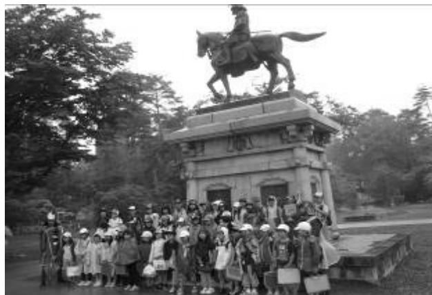
【3 学年 仙台市内名所めぐり】