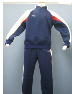
選定された 体育着の見本

9月5日(水)には業者説明会を行い、業者から提案された体育着について説明を受け、選定メンバーがそれぞれの体育着についてデザインや販売方法等の評価を行いました。その結果、右の写真の体育着が選定されました。今後は細部のデザイン等、詳細についてつめていくことになります。