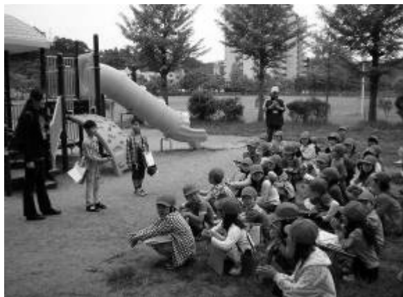
【2 学年 まち探検】