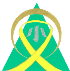
泉松陵小学校 の校章

泉松陵小学校の新しい校章案を作成するため、松陵・松陵西の両小児童に校章案を募集しましたところ、210 点の応募がありました。