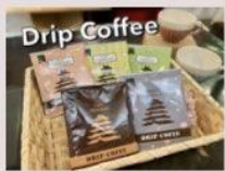
鶴ヶ城 オンラインストアから引用