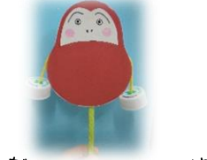
だるまのでんでん太鼓