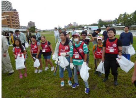
〔活動内容の説明を聞いています〕