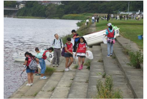
〔水辺に落ちていたゴミも拾いました〕