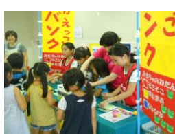
【児童館とりかえっこ】