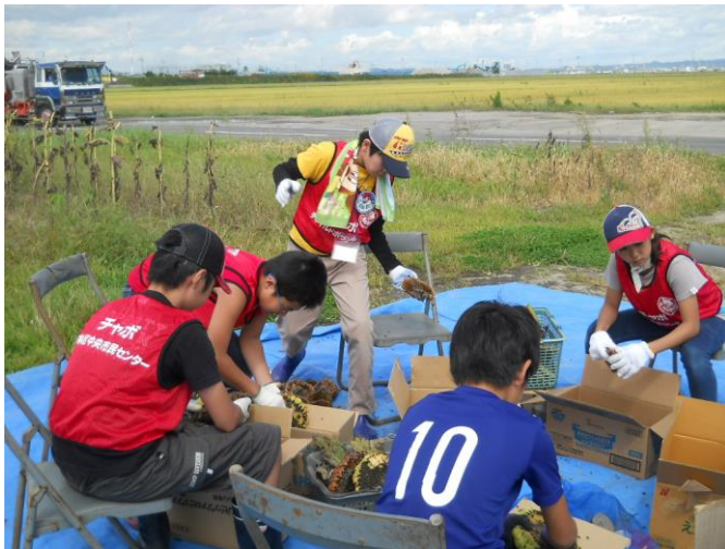
〔ひとつひとつブラシを使って種をとりました〕