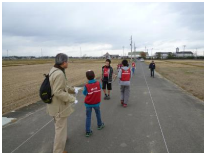
〔大凧あげの準備中です〕