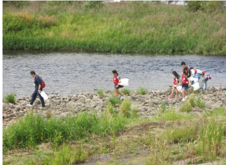
〔河原を歩いてゴミを探しています〕