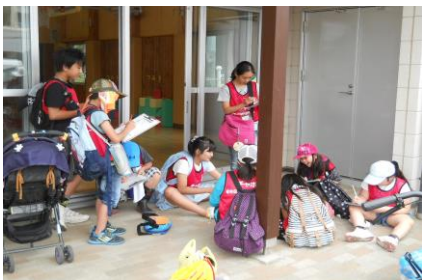
今日の活動の記録を書いています