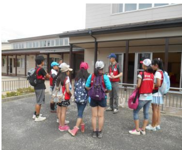
大和児童館に集って活動開始です

6月28日（土）は、「まち歩きゴミ拾い隊」として大和町方面に今年度 1 回目のゴミ拾い活動に行ってきました。天気予報では雨も心配されましたが、何とか降られることもなく約4kmのコースをゴミ拾いしながら歩きました。9人のチャボメンバーが1時間くらいの活動で集めたゴミの量は、たばこのすいから633本のほかペットボトルや空き缶など4.1kgもありました。活動中には、道ですれ違う地域の方から「ごくろうさま！」「ありがとう！」などと声をかけていただきました。