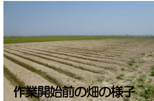
作業開始前の畑の様子