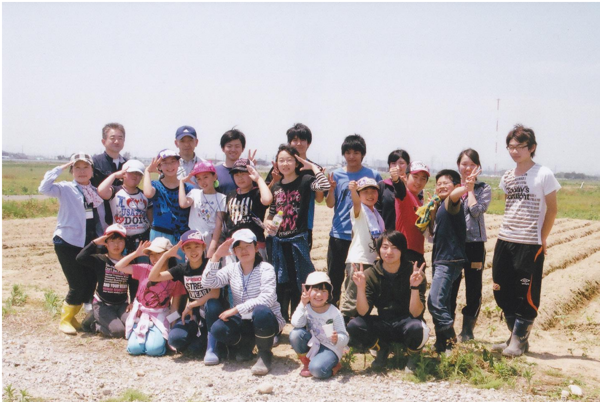
リルーツのスタッフの皆さんと記念撮影

ひさしぶりのリルーツ さんとの活動がとても楽 しかったです。あつくて つらいときもあったけ ど、がんばってできまし た。