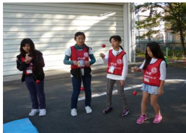
〔けん玉練習中です〕