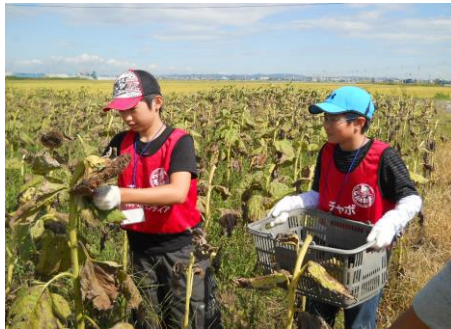
〔2人一組で花を収穫しました〕