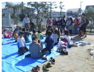
〔遠見塚児童館で活動を紹介しました〕

集めたゴミの重さは3kgだと思います。思ったよりゴミがたくさんあったので、大変でした。