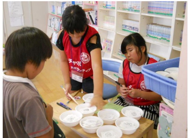
〔工作コーナーで遊び方の説明をしました〕