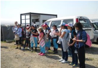
リルーツさんで朝の挨拶