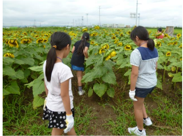
【宝さがしに出発です】