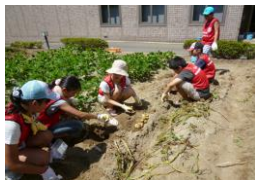
【仙白園収穫祭準備】