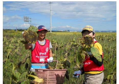
〔切り取った花を集めて種をとります〕