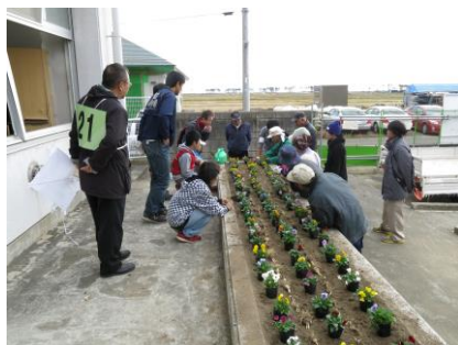
〔配置も考えて植えました〕