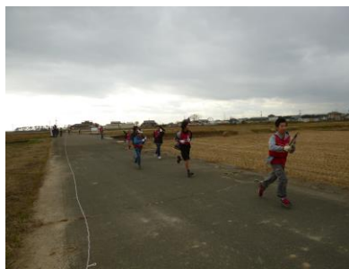
〔糸を引いて全力で走りました〕