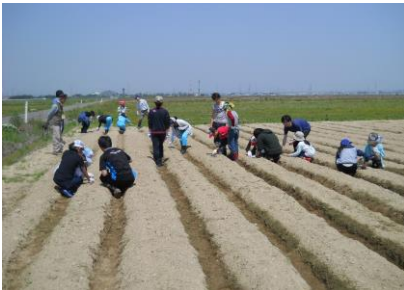
暑い中、協力して作業をしました。