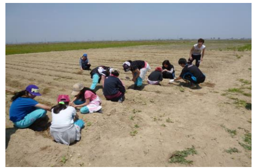
最後にみんなで雑草取りもしました。