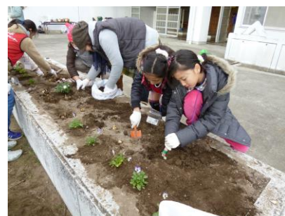
〔球根は深く掘って植えました〕