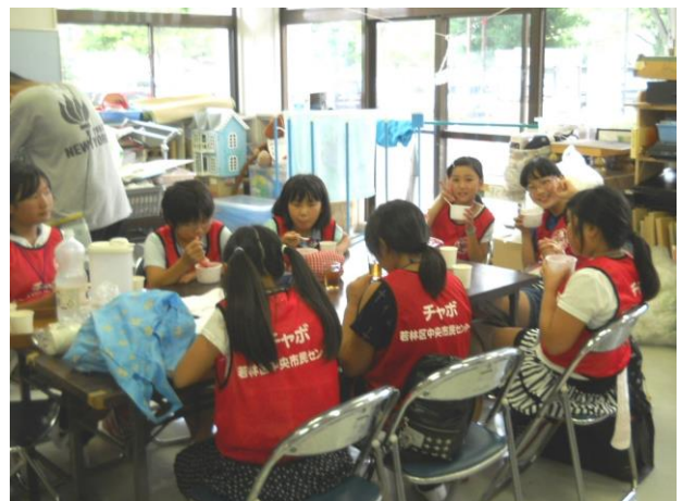
〔最後にみんなでかき氷をいただきました〕