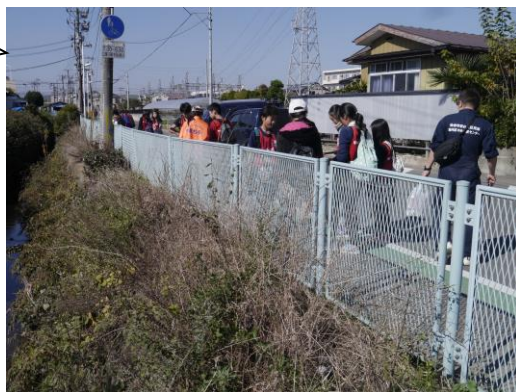
〔水路わきにはたくさんのゴミが落ちていました〕

たばこを100本拾うことを目標にしていたのですが、61本でした。でも、たばこが落ちていないことはいいと思いました。