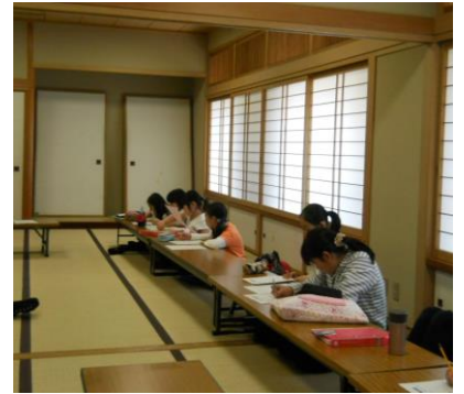
活動説明会の様子

最後に活動の振り返りをしました。活動の様子の写真といっしょにチャボたちの感想を載せたいと思います。