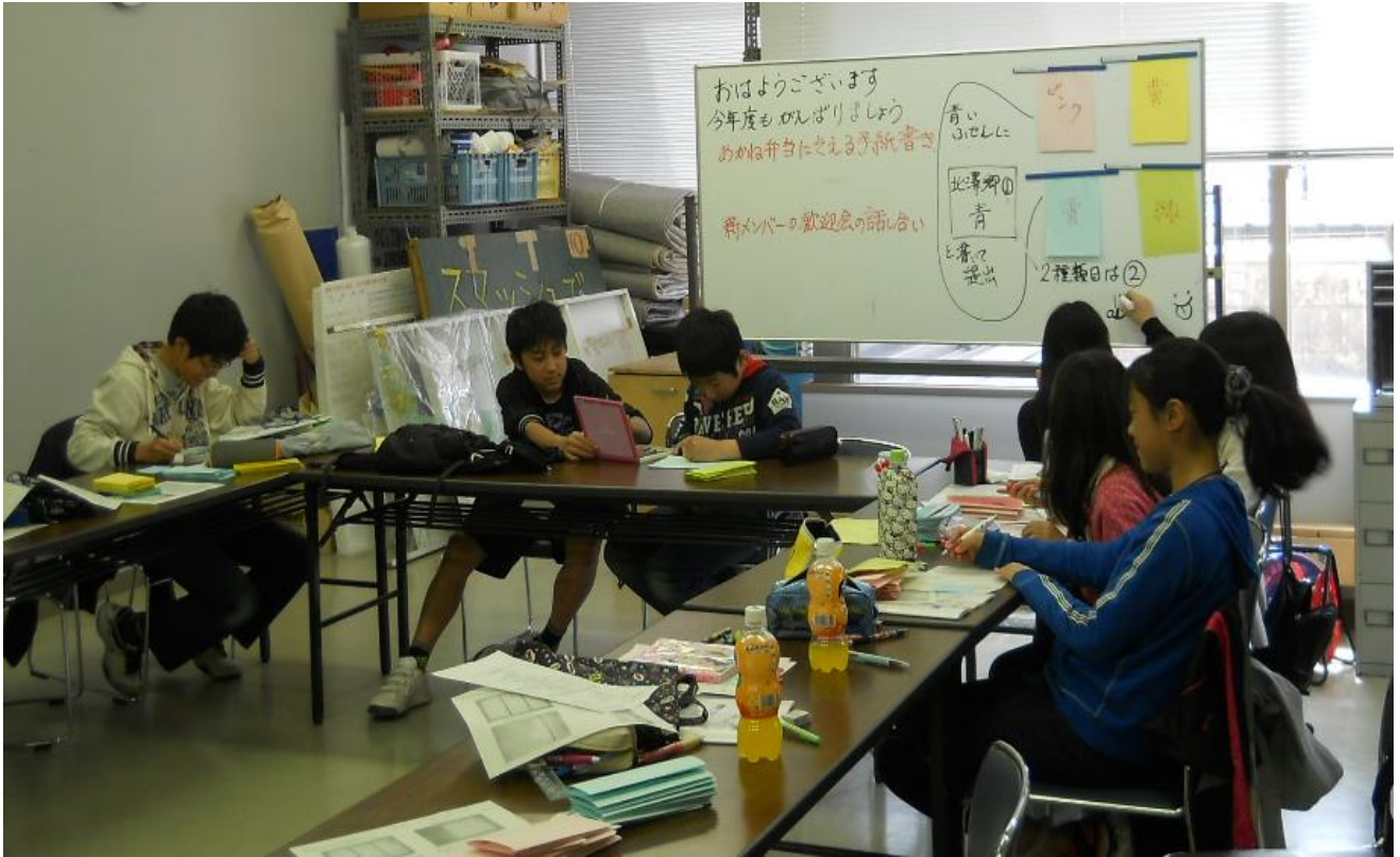
「あかね弁当」にそえるお手紙書きの様子

これを読んでくれているみなさんもチャイルドボランティアとして活動してみませんか。みんなの力をかしてください！