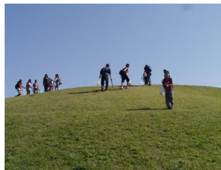
〔古墳の上もゴミがないか見ました〕

今日はあまりゴミを拾えませんでした。なので、今度は多く拾えるようにがんばります。