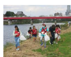
【広瀬川流域一斉清掃】