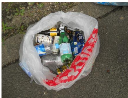
ペットボトル・ビン・缶も拾いました