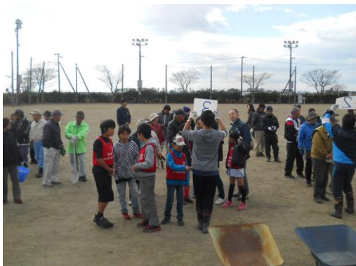
〔活動の前に説明を聞きました〕

花植えで穴を掘るのが大変だった。でも、みんなで協力したので早く終わらせることができました。