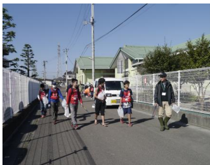
〔遠見塚児童館から元気に出発です〕

11人のチャボメンバーが1時間半くらいの活動で集めたゴミの量は、たばこのすいがらのほかペットボトルや空き缶など4.2kgもありました。