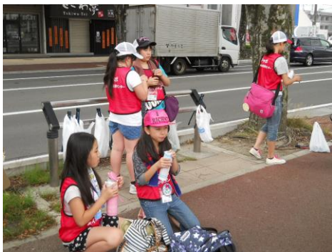
コースの途中でひと休みです