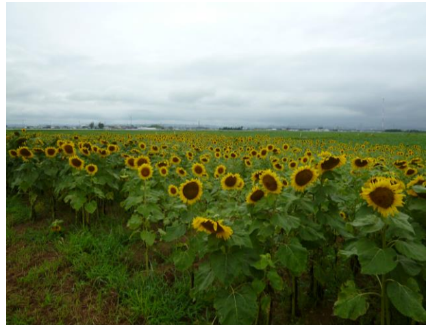
【チャボが種まきをした畑でもひまわりが満開でした】