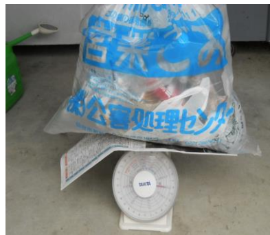
みんなが拾ったゴミを集めて重さを量りました