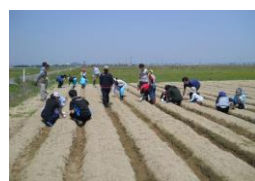
【震災復興・地域支援活動団体 ReRoots さん ひまわりプロジェクト】