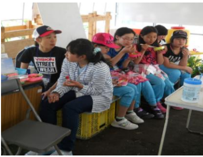
作業を終えておひるごはんです。