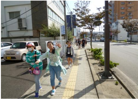
〔徒歩で活動場所に向かっています〕

9月27日(土)は「広瀬川流域一斉清掃」に参加してきました。若林区中央市民センター前に集合した後、宮沢橋左岸の宮沢緑地まで徒歩で移動し、清掃活動に取り組みました。去年よりもゴミの量は少なくなりましたが、肉が入ったままのトレーが川の岸に捨てられていたり、ペットボトルやビニール袋なども落ちていました。短い時間でしたががんばって活動してきました。