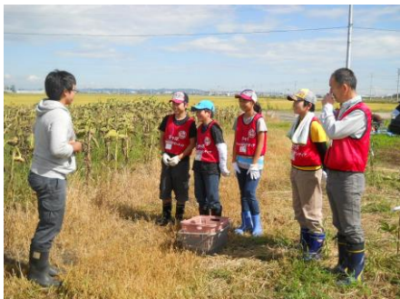
〔収穫の前に作業の説明を聞きました〕

9月13日（土）は、7日（日）の予定が雨天のために順延されていた「ひまわりの種の収穫」に行ってきました。日程が変更になったため、参加したメンバーは4名と少なくなってしまいましたが、参加できなかったメンバーの分まで一生懸命活動してきました。翌週の9月20日（土）には、年配の方に届ける宅配弁当にそえるお手紙書きをしました。