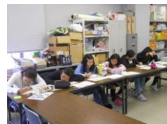
【NPO 法人あかねグループさん 宅配弁当にそえるお手紙書き】