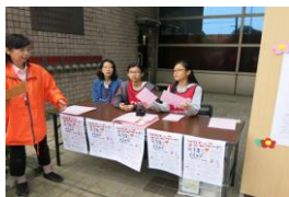
【ワカチュウ子どもランド】