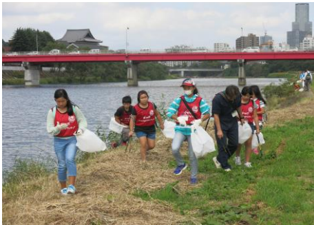
〔草の中も気をつけて見ました〕