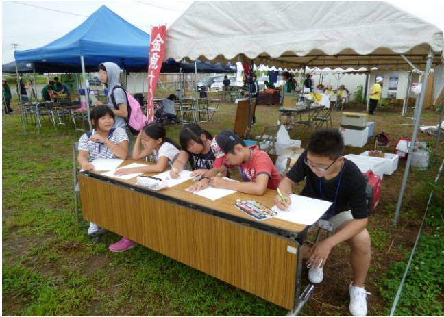
【ひまわりを前に真剣にお絵かき中です】

8月9日（土）は、荒浜地区のひまわり畑で開催された「ひまわりまつり」に行ってきました。5月にチャボが種まきをした畑とは別の畑でしたが、約2,000本のひまわりが満開になった畑で写生会に参加しました。お絵かきの後には、畑の中に隠されているカプセルを見つけて、中に入っている問題に正解すると景品がもらえる宝さがしにも参加してきました。