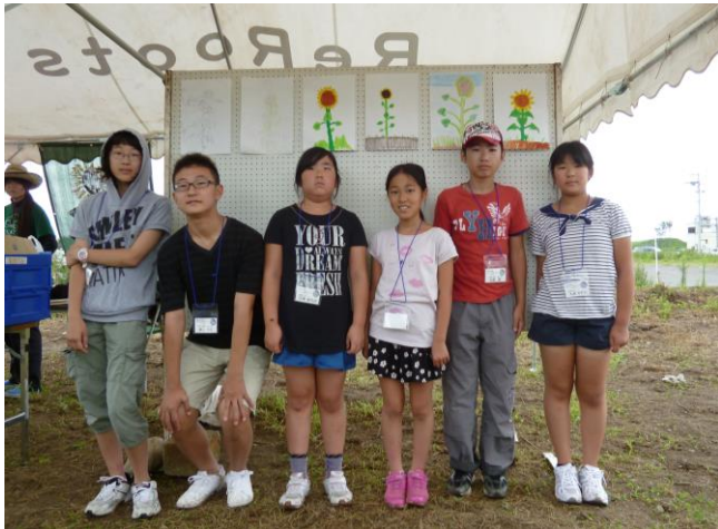
【自分の描いた作品の前で記念撮影】