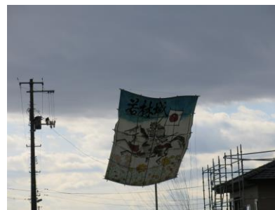
〔見事にあがりました〕