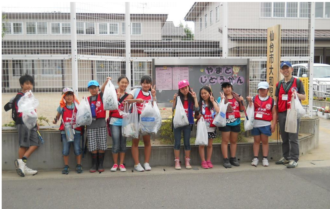
拾ってきたゴミを持って記念撮影 みんながんばって拾いました

車のホイールキャップが落ちていてびっくりしました。たばこのすいがらを114本拾いました。