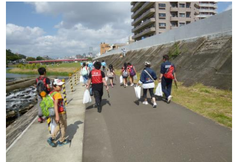
〔集めたゴミを手に戻るところです〕