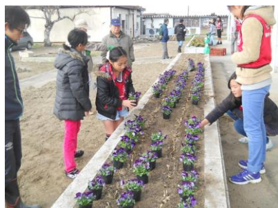
〔植える前にきれいに並べました〕