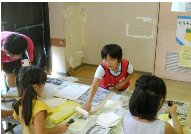
〔壁紙にのりのつけ方を教えています〕