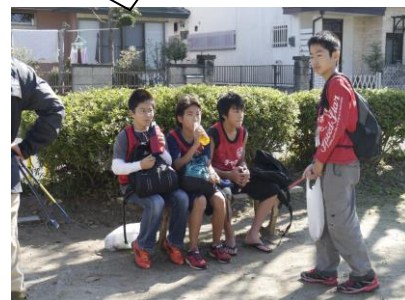
〔活動の途中でひと休み〕

たばこを100本拾うことを目標にしていたのですが、61本でした。でも、たばこが落ちていないことはいいと思いました。