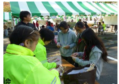
〔わりばし鉄砲づくり〕