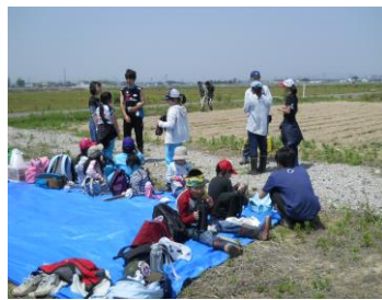
ひと休みの時間です