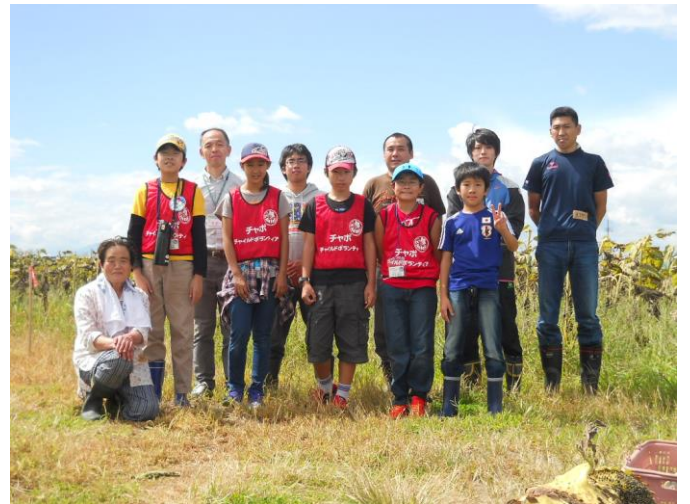
〔一緒に活動したボランティアのみなさんと記念撮影〕