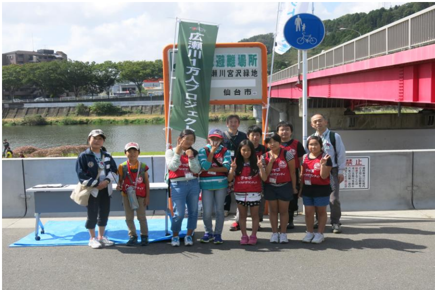
〔天気にも恵まれみんな元気に活動することができました〕