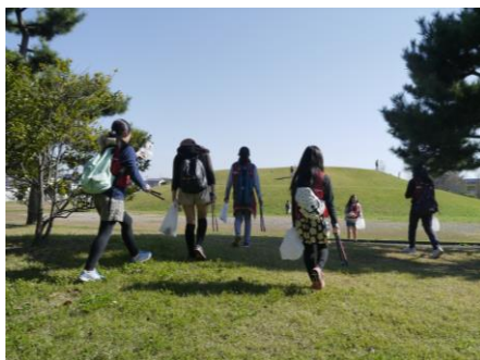
〔遠見塚古墳に到着〕