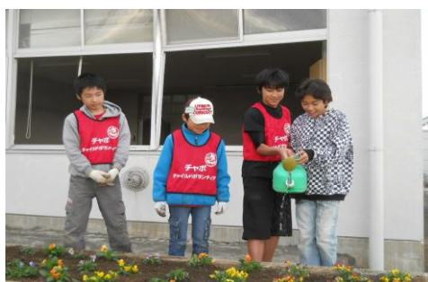
〔水やりもしてきました〕