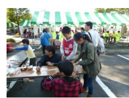
【区民ふるさとまつり】