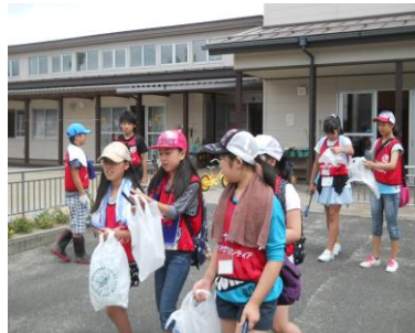
元気に出発しました