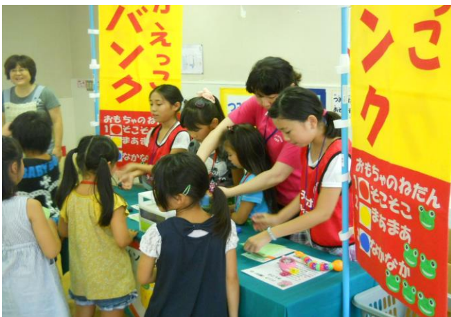
〔銀行ではおもちゃにポイントをつけました〕

8月22日（金）は、「とり+かえっこ in 若林区中央児童館」のお手伝いをしてきました。お手伝いの内容は、参加者が持参した使わなくなったおもちゃが「そこそこ」なものか「まあまあ」なものか「なかなか」なものかを判断して1～3のポイントをつける「銀行」の仕事、汚れた壁をきれいにする「壁紙はり」コーナー、「ようかいUFO」を作って飛ばす工作コーナーなどです。ジュニアリーダーのお兄さんお姉さんや職場体験学習に来ていた中学生のお兄さんたちとも一緒に楽しく活動することができました