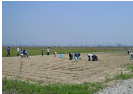
約40うね。約4000この種をまきました。

ひさしぶりのリルーツ さんとの活動がとても楽 しかったです。あつくて つらいときもあったけ ど、がんばってできまし た。