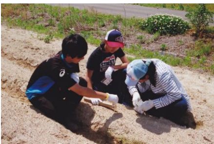
おにいさんがつけてくれた目印に種をまきました

ひまわりの種まきははじめてだったけど、6年生や大学生の人たちとできてよかったです。スピーディに上手にできました。