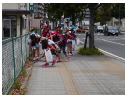
【まち歩きゴミ拾い隊 Part1・大和町地区】