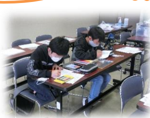
◀▲高齢者の方に配達される弁当にそえるお手紙書き（月1回）