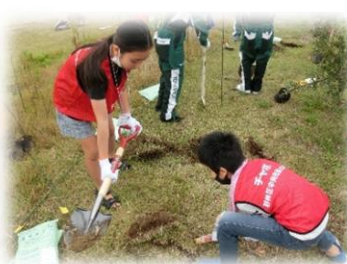
▲沿岸部における植樹・育樹活動